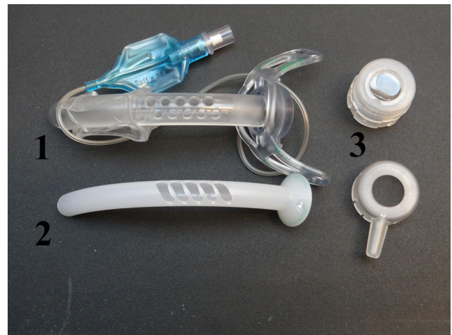
Fig. 3 Canule de trachéotomie fenêtrée : 1) canule externe fenêtrée avec ballonnet basse pression ; 2) chemise interne fenêtrée ; 3) valve phonatoire

la canule de trachéotomie, il est possible d'utiliser ce type de canule appelée canule fenêtrée. Cette canule favorise le passage de l'air vers les cordes vocales et donc la phonation et s'utilise dans cette indication avec une valve phonatoire. Les chemises internes de ce type de canule peuvent être fenêtrées ou non ;