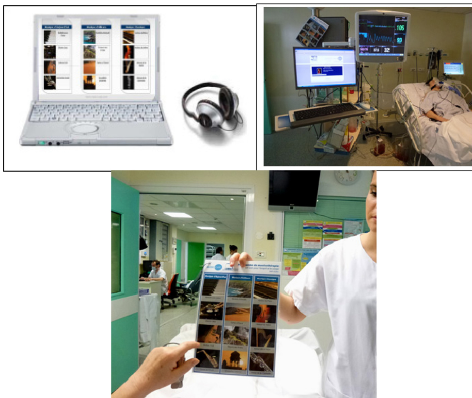
Fig. 2 Music Care : une solution thérapeutique standardisée, reproductible et généralisable

La réussite de la mise en place d'une nouvelle « technique de soin » est soumise à une réelle volonté de service et doit être